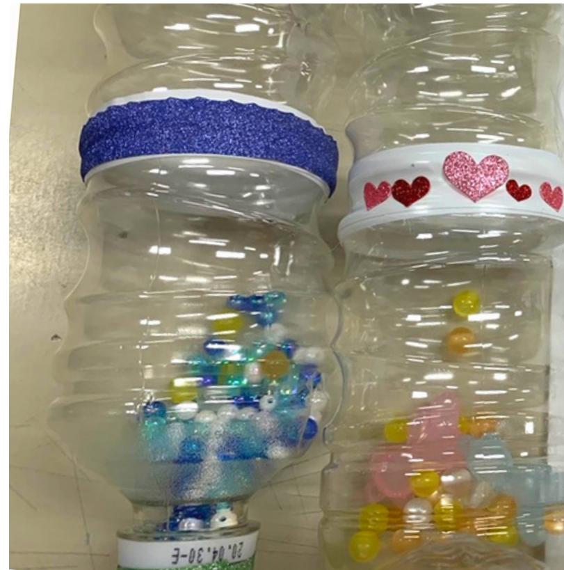
2. ペットボトルマラカス